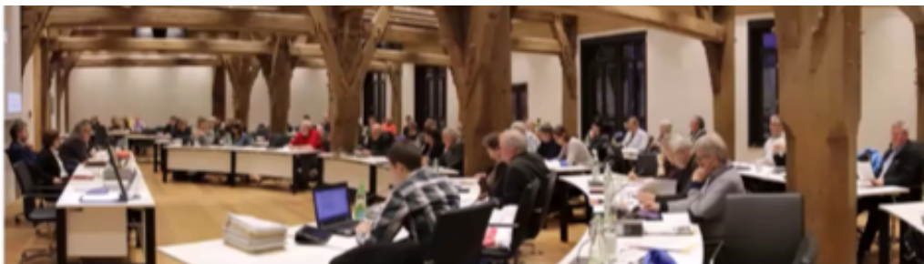
Simulation einer Gemeinderatssitzung